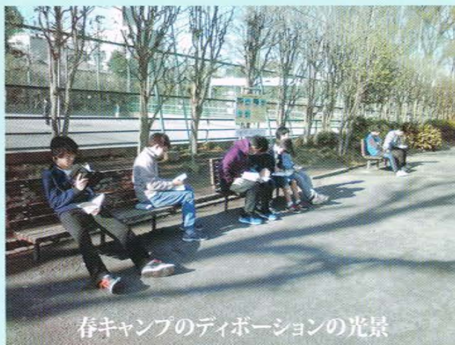
春キャンプのディボーションの光景

聖書同盟は、これまでの中学生伝道への取り組みを主に感謝しつつ、聖書通読の恵みが力強く次世代に引き継がれ、一人でも多くの子どもたちが救われるために、児童伝道の働きに力を入れていきます。